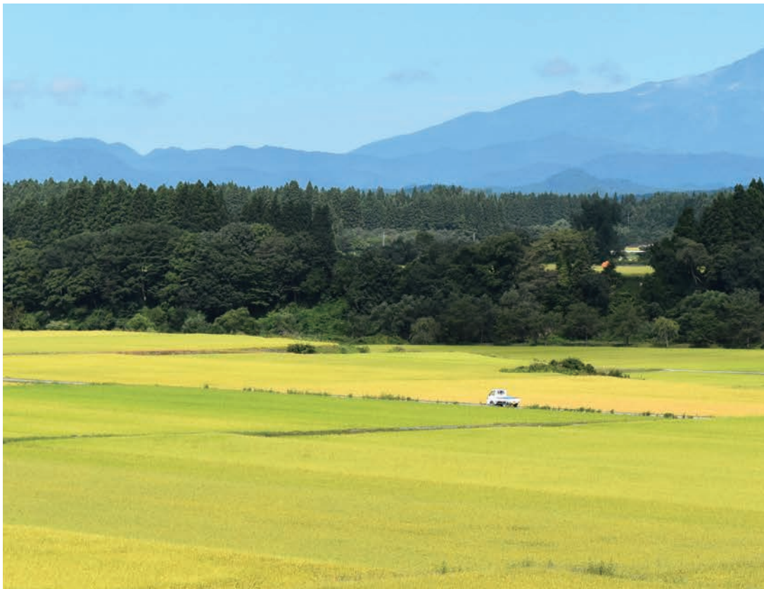
鳥海山を臨む山形の田園風景

を繰り返しながら肥沃な土をも作り上げてきた。そして農家もまた父祖の代から長い時をかけて、コメ作りに適した肥沃な土を作り育ててきた。