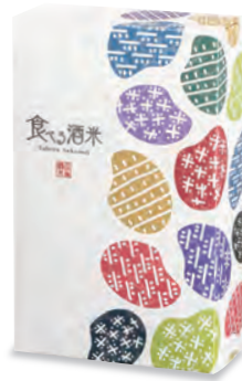
贈答用化粧箱2個入り