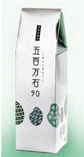
2合(300g)入り 756円(税込) 原材料：米(新潟県産)

淡麗系のお酒を醸す五百万石は、ご飯に炊いてもきりっとした淡白な味わいが魅力です。クセがないため、どんな料理にも合わせやすい美味しい酒米です。