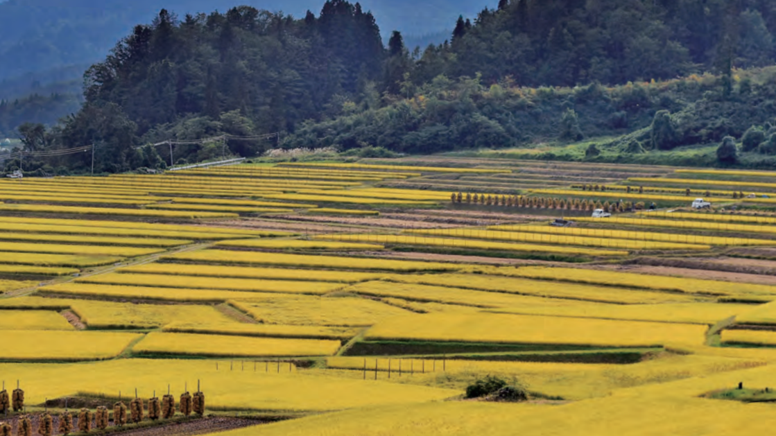
「棚田、豊穰の秋」(朝日町椹平)