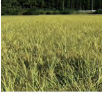
酒米の里 金山の出羽燦々