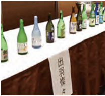
出羽燦々が醸す吟醸酒