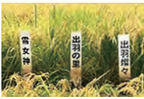
山形の酒米三部作