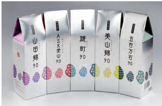
(左から)山田錦/ASK愛山/雄町/美山錦/五百万石 各2合(300g)入り 756~950円(税込)